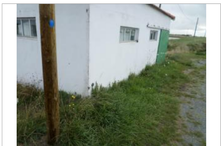
Macaron Xynthia sur mur

GÉNÉRAL Code : CdCIO2010_R_DOL4_4 Date de mise à jour : 01/02/2019 Auteur : Yoann Chaussée