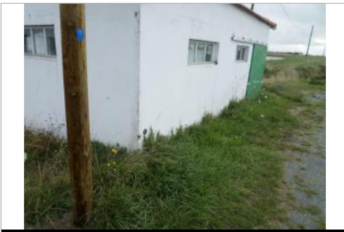
Macaron Xynthia sur mur

GÉOLOCALISATION Coordonnées WGS84 : X: -1.24433900 / Y: 45.93417220 Coordonnées RGF93 (Lambert 93) X: 371283.5 / Y: 6546000.26 Coordonnées RGF93 (ETRS89) : X: -1.244339 / Y: 45.9341722 Code Hydro: _OATLANT Rive de référence: Non renseigné