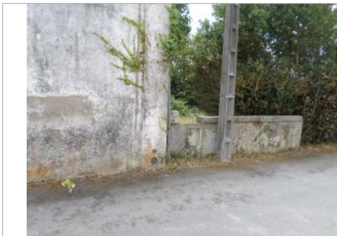
Macaron Xynthia sur mur