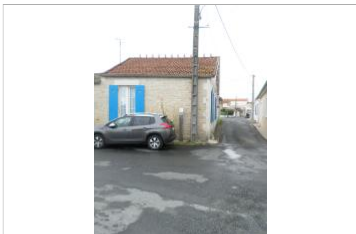
Totem bois avec coiffe et macaron

Code : CdCIO2010_R_CHA4_4 Date de mise à jour : 17/04/2018 Auteur : Yoann Chaussée