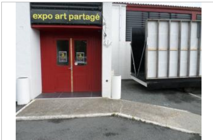
Macaron Xynthia sur mur