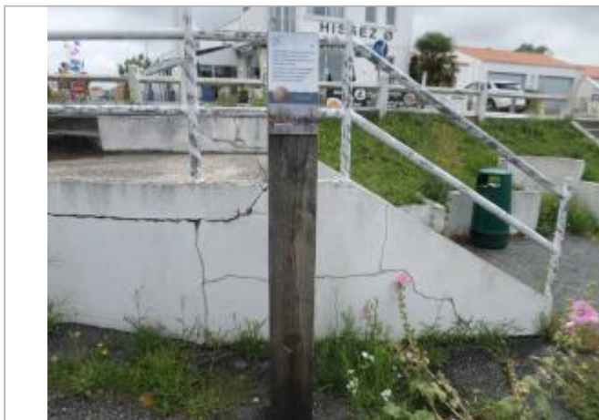
Totem bois avec coiffe et macaron