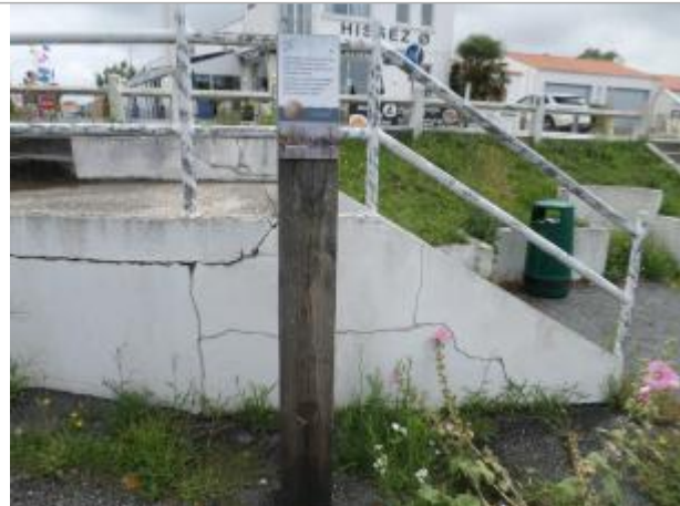
Totem bois avec coiffe et macaron