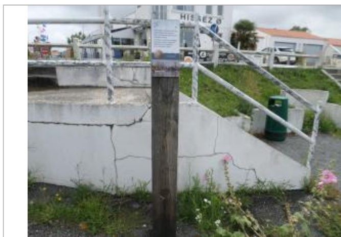
Totem bois avec coiffe et macaron