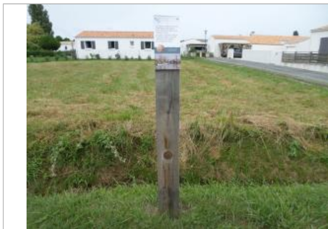
Totem bois avec coiffe et macaron

Altitude calculée de l'eau (en m) : 3.64