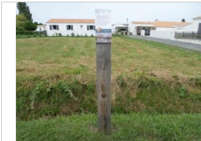
Totem bois avec coiffe et macaron