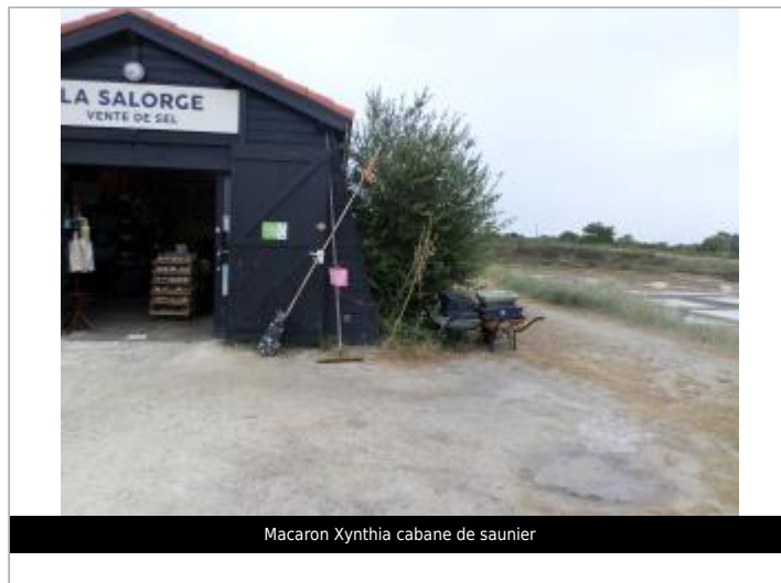
Macaron Xynthia cabane de saunier

GÉOLOCALISATION Coordonnées WGS84 : X: -1.22904140 / Y: 45.86239020 Coordonnées RGF93 (Lambert 93) X: 372040.41 / Y: 6537976.71 Coordonnées RGF93 (ETRS89) : X: -1.2290414 / Y: 45.8623902 Code Hydro: _OATLANT Rive de référence: Non renseigné