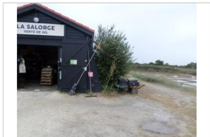
Macaron Xynthia cabane de saunier

GÉNÉRAL Code : CdCIO2010_R_GVP3_3 Date de mise à jour : 19/02/2018 Auteur : Yoann Chaussée