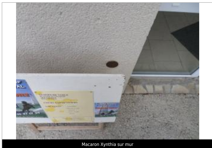
Macaron Xynthia sur mur