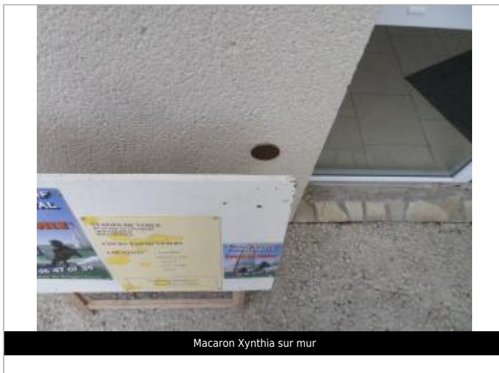
Macaron Xynthia sur mur