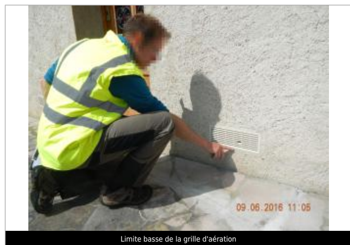
Limite basse de la grille d'aération