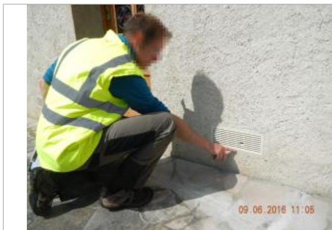
Limite basse de la grille d'aération