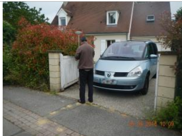
3 allée le Clos Bazin, lotissement presque entièrement inondé