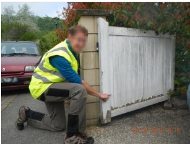
Laisse de crue laissée sur le portail

Altitude calculée de l'eau (en m) : 36.746 m