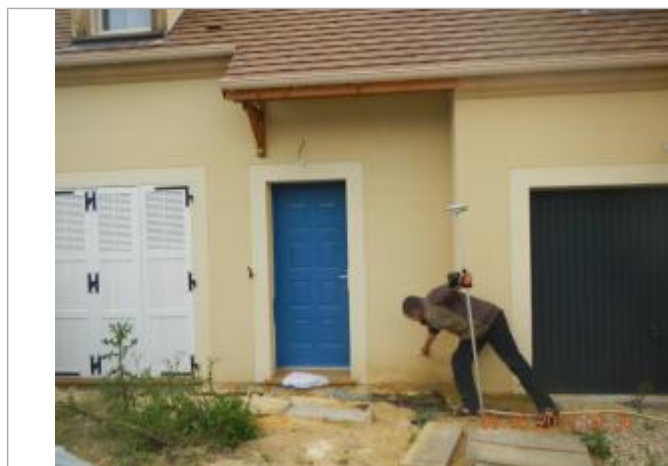
Ligne horizontale nette laissée sur le crépis de la propriété