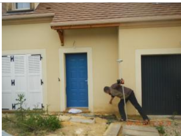
Ligne horizontale nette laissée sur le crépis de la propriété