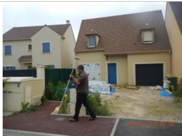
Maison à droite en descendant l'impasse A. CAMUS