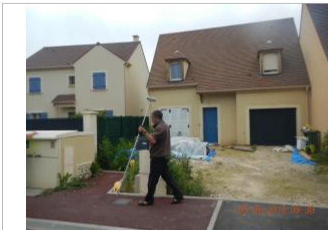
Maison à droite en descendant l'impasse A. CAMUS

Coordonnées WGS84 : X: 1.85534840 / Y: 48.90664000