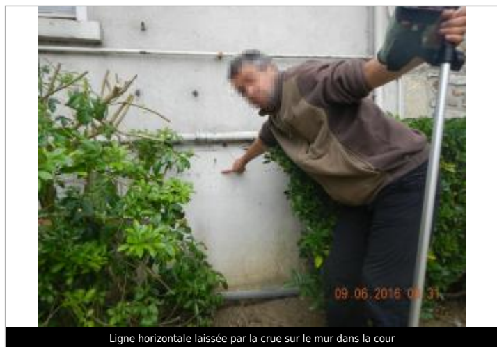
Ligne horizontale laissée par la crue sur le mur dans la cour