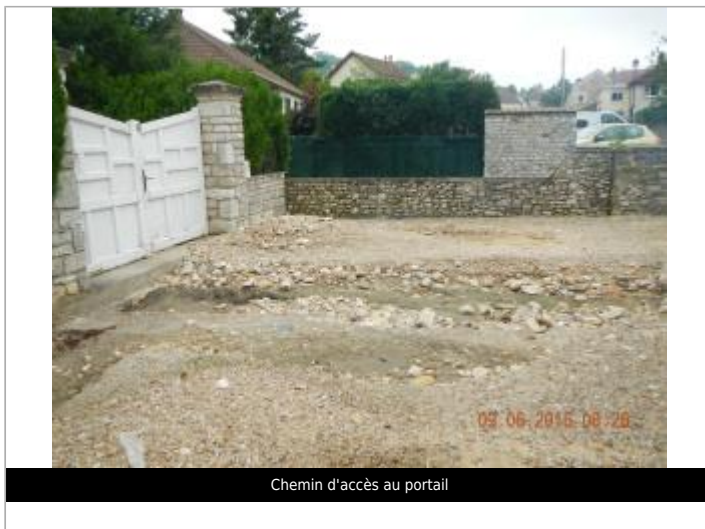
Chemin d'accès au portail