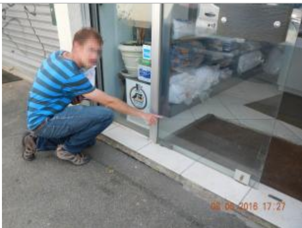
Ligne horizontale laissée par la crue sur la vitrine du commerce