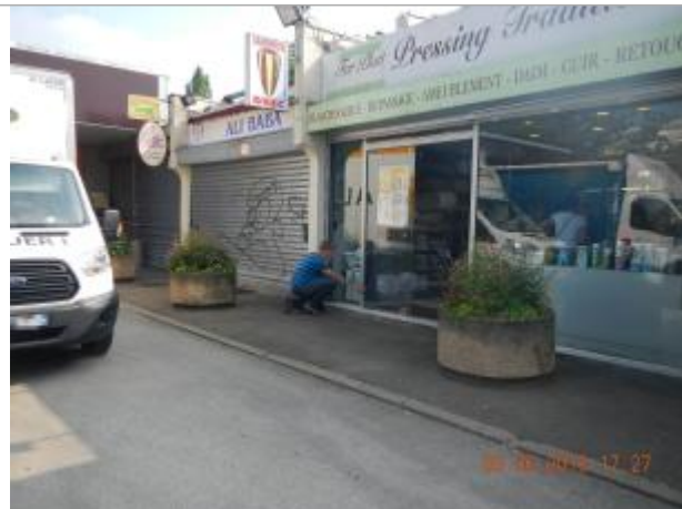
Placette / parking pour petits commerces en amont du pont