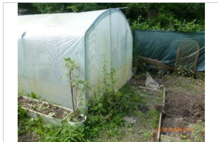
Ligne horizontale laissée par la crue sur une serre dans le jardin