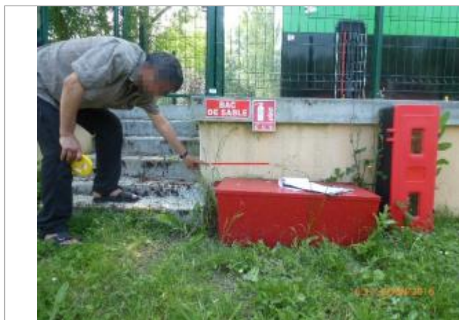
Marque horizontale laissée par la crue au dessus d'un bac de sable sur le parking

Code : WEB_R_201712124457 Date de mise à jour : 06/07/2018