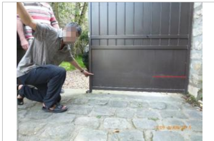
Portail du 4 place de l'eglise

GÉOLOCALISATION Coordonnées WGS84 : X: 1.84228820 / Y: 48.92952800 Coordonnées RGF93 (Lambert 93) X: 615176.29 / Y: 6870571.62 Coordonnées RGF93 (ETRS89) : X: 1.8422882 / Y: 48.929528 Code Hydro: H30-0400 Rive de référence: