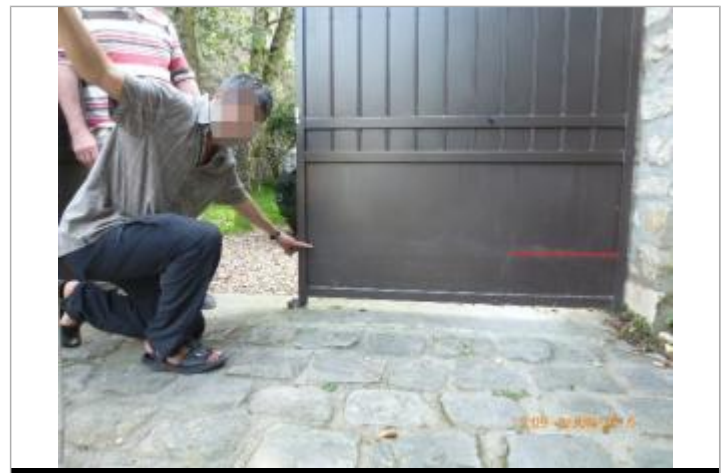
Laisse d'inondation sur le portail coté cour

MARQUE Maximum de l'inondation : Oui Visibilité : Oui État du repère : Bon Pérennité : Aucune