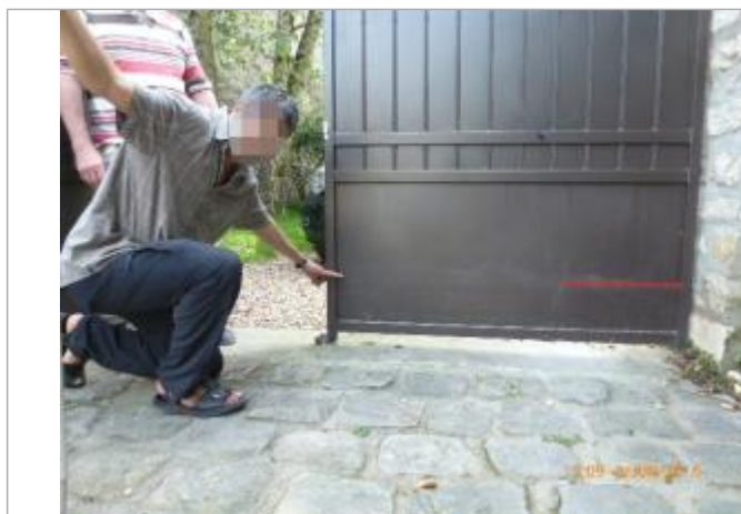
Laisse d'inondation sur le portail coté cour