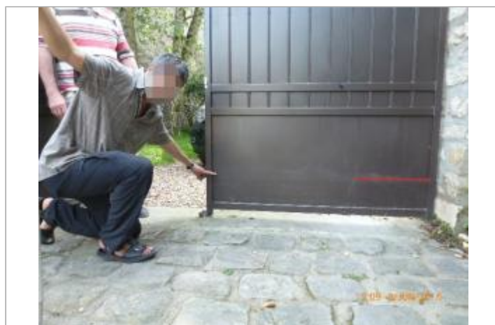
Portail du 4 place de l'église

GÉOLOCALISATION Coordonnées WGS84 : X: 1.84228820 / Y: 48.92952800 Coordonnées RGF93 (Lambert 93) X: 615176.29 / Y: 6870571.62 Coordonnées RGF93 (ETRS89) : X: 1.8422882 / Y: 48.929528 Code Hydro: H30-0400 Rive de référence: