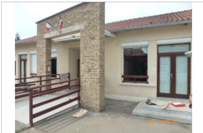
Ecole primaire d'Aulnay sur Mauldre