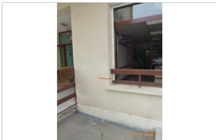
Laisse sur le rebord d'une fenêtre, façade principale, côté entrée droit