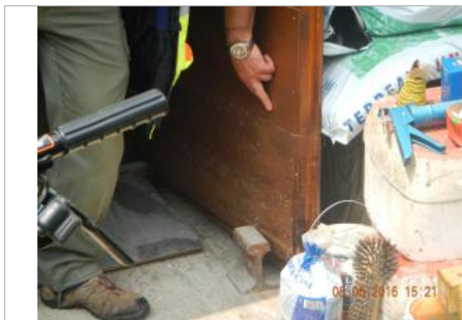
Ligne horizontale très nette laissée par la crue sur l'abri de jardin