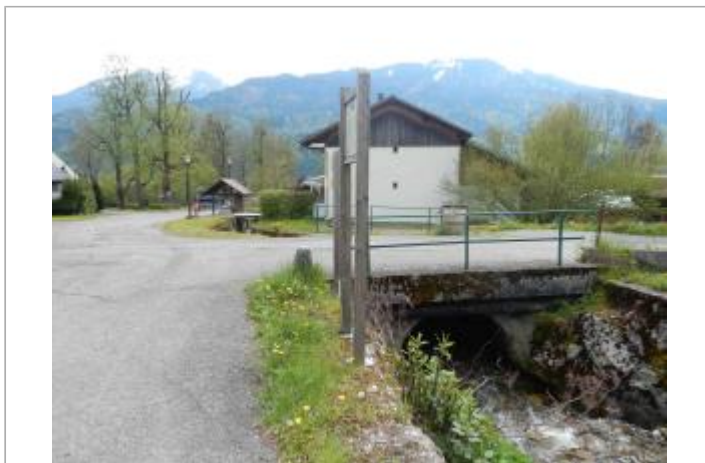
site du pont de Bérrouze, ruisseau de Lachat