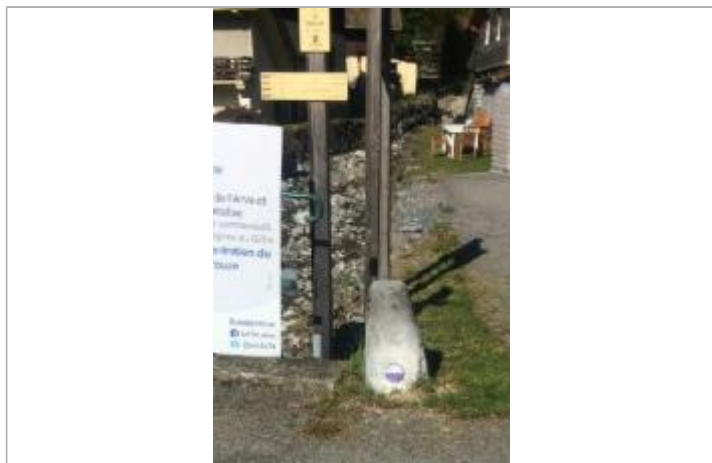
Crue du 24 juin 1994, ruisseau de Lachat