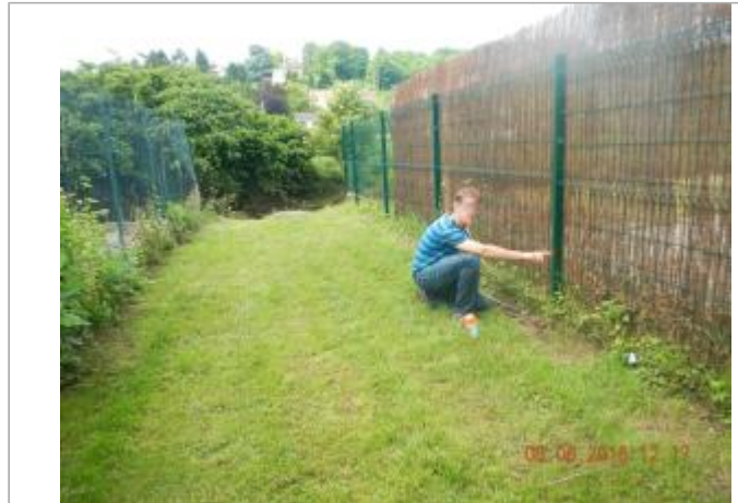
Ruelle du petit moulin menant à la Mauldre