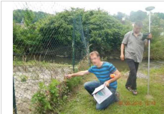
Dépot végétal sur un grillage perpendiculaire à la Mauldre