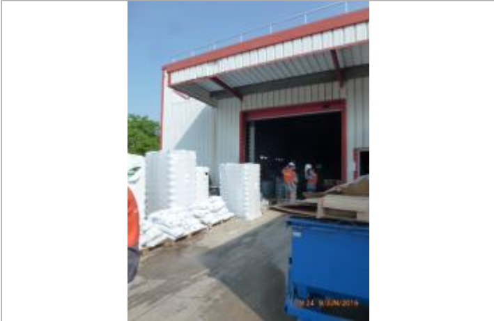
Hangar devant lequel le nivelement a été fait