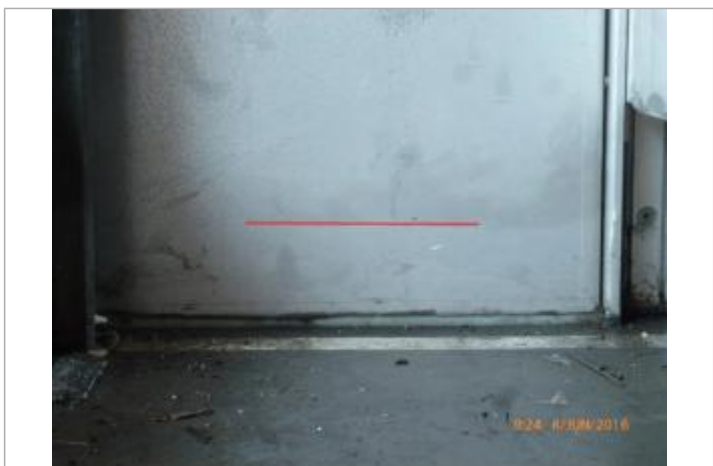
Laisse d'inondation sur la porte intérieure du hangar

MARQUE Maximum de l'inondation : Oui Visibilité : Non État du repère : Disparu Pérennité : Aucune