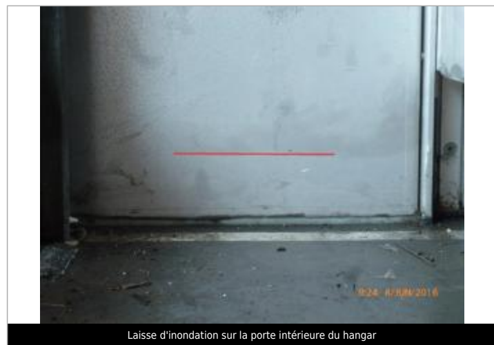
Laisse d'inondation sur la porte intérieure du hangar