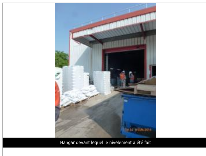
Hangar devant lequel le nivellement a été fait