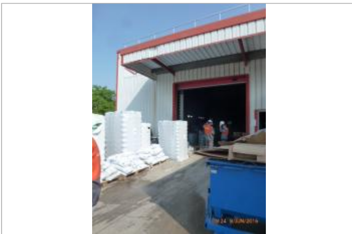
Hangar devant lequel le nivelement a été fait

GÉOLOCALISATION Coordonnées WGS84 : X: 1.82426250 / Y: 48.95913400 Coordonnées RGF93 (Lambert 93) X: 613904.69 / Y: 6873883.07 Coordonnées RGF93 (ETRS89) : X: 1.8242625 / Y: 48.959134 Code Hydro: H30-0400 Rive de référence: