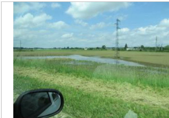
Site pendant la crue de juin 2016