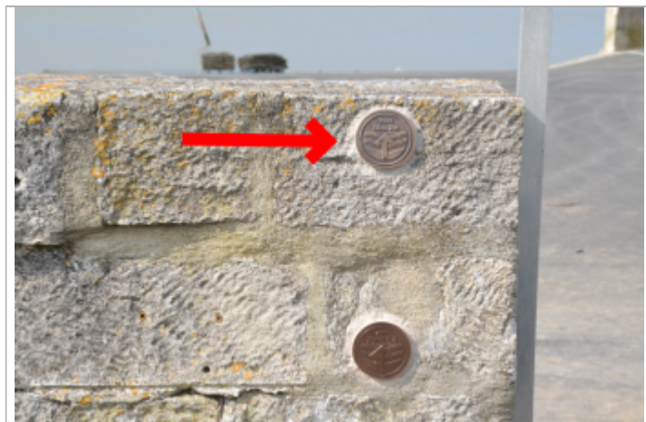
Repère Martin Pointe du Chapus