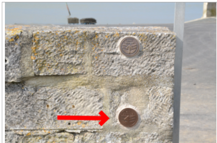
Repère Xynthia Pointe du Chapus