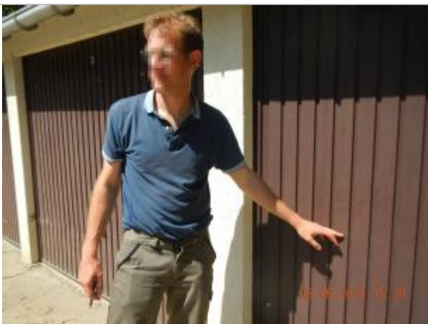
Ligne de garages à la confluence entre la Mauldre et le ruisseau du Maldroit, route Frileuse