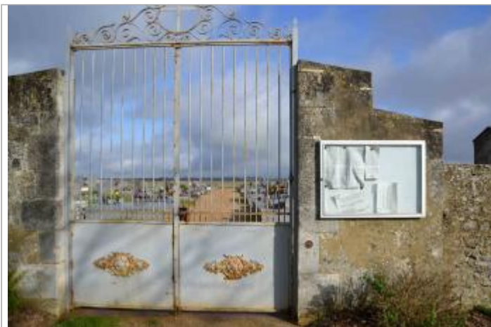
Repère Xynthia à l'entrée du cimetière de l'Eguille