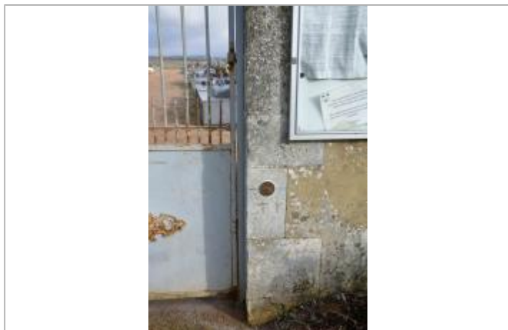
Repère Xynthia cimetière de l'Eguille