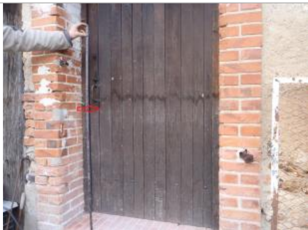
Détail du repère