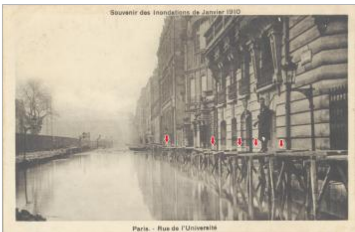
Carte postale de 1910, faisant apparaître une marque supposée (délavage)

Maximum de l'inondation : Oui Visibilité : Non État du repère : Disparu