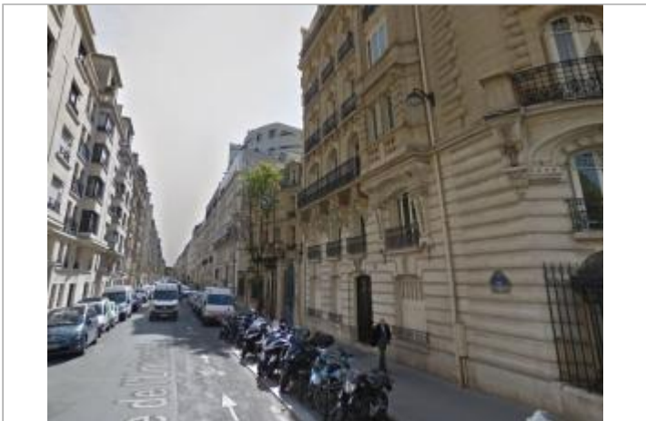
Vue de la façade depuis la rue (2016)