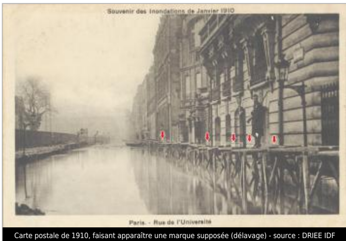
Carte postale de 1910, faisant apparaître une marque supposée (délavage)

Maximum de l'inondation : Oui Visibilité : Non État du repère : Disparu