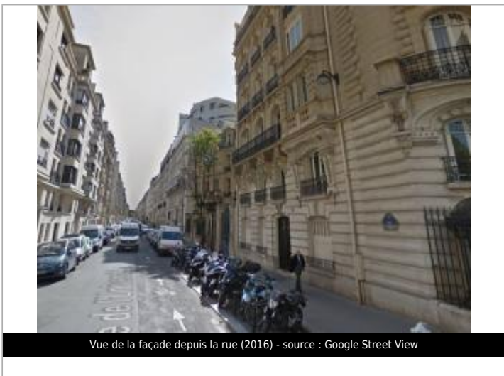
Vue de la façade depuis la rue (2016)