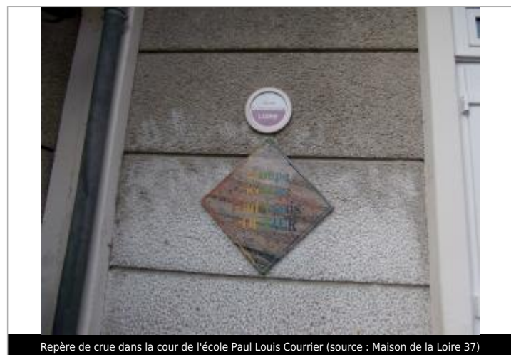
Repère de crue dans la cour de l'école Paul Louis Courier

GÉNÉRAL Code : WEB_R_201711241553 Date de mise à jour : 27/12/2020 Auteur : LOIRE37