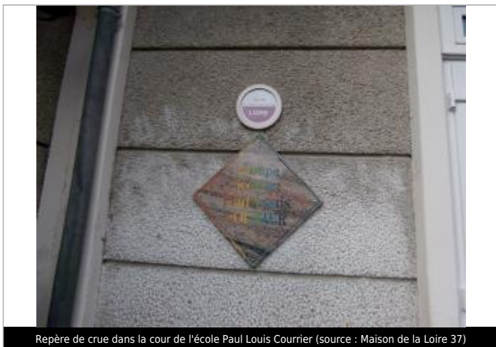
Repère de crue dans la cour de l'école Paul Louis Courier

Texte : CINQ MARS LA PILE / JUIN 1856 / Plus Hautes Eaux Connues / LOIRE Maximum de l'inondation : Oui Visibilité : Oui État du repère : Bon Pérennité : Longue