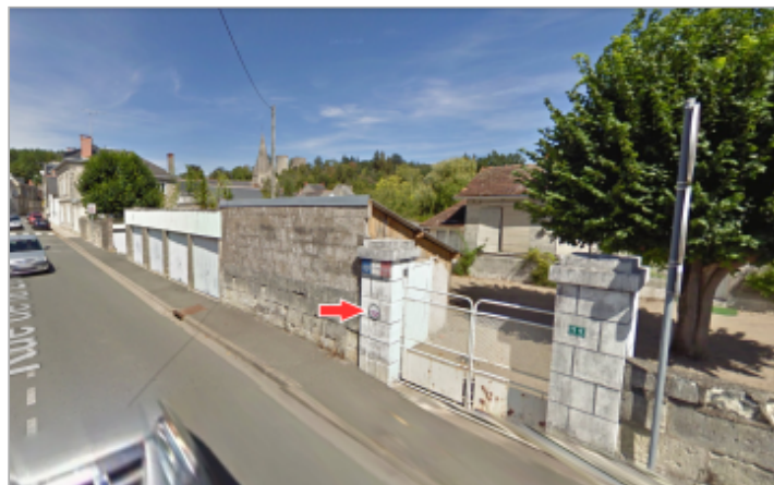
Vue d'ensemble du site