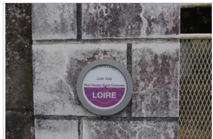
Détail du repère