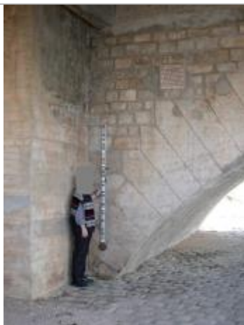
Culée rive droite aval du pont de Joigny (01/10/2002)

Altitude calculée de l'eau (en m) : 78.417 m