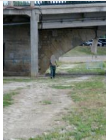
Vue de l'arche de décharge du pont de Joigny depuis l'aval le 11 août 2010

Code Hydro: F3--0200 Rive de référence: Droite