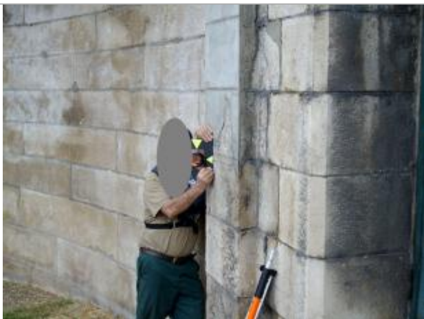
Repère de 186(6), situation (culée rive droite aval)