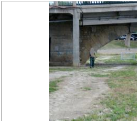
Vue de l'arche de décharge du pont de Joigny depuis l'aval le 11 août 2010

Coordonnées WGS84 : X: 3.39569460 / Y: 47.98153900