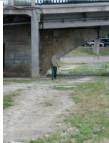
Vue de l'arche de décharge du pont de Joigny depuis l'aval le 11 août 2010

Code Hydro: F3--0200 Rive de référence: Droite