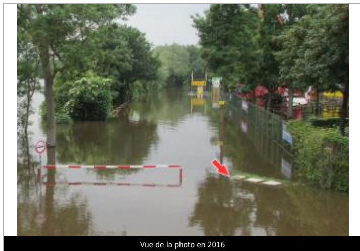
Vue de la photo en 2016

Altitude calculée de l'eau (en m) : 53.36 m