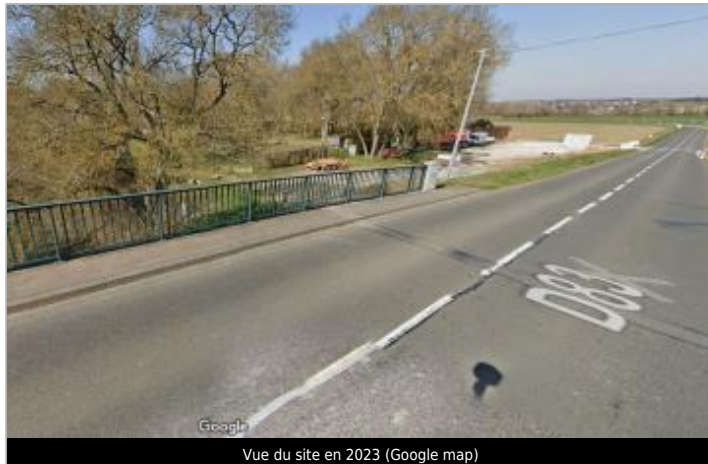
Vue du site en 2023