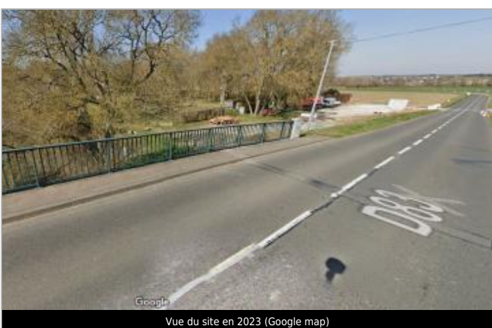
Vue du site en 2023

GÉOLOCALISATION Coordonnées WGS84 : X: 0.90883752 / Y: 47.34342700 Coordonnées RGF93 (Lambert 93) X: 542128.58 / Y: 6695767.95 Coordonnées RGF93 (ETRS89) : X: 0.9088375 / Y: 47.343427 Code Hydro: K--0090 Rive de référence: Droite