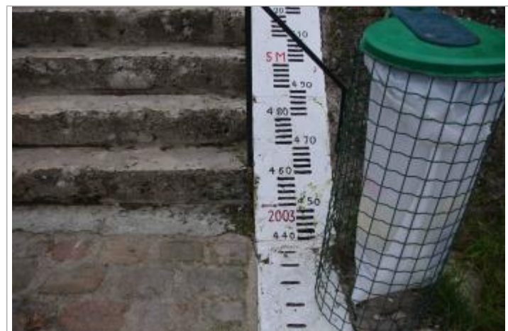
Marque de la crue de 2003 (source : Maison de la Loire 37)