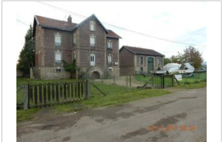
Maison éclusière (photo SPC SACN)