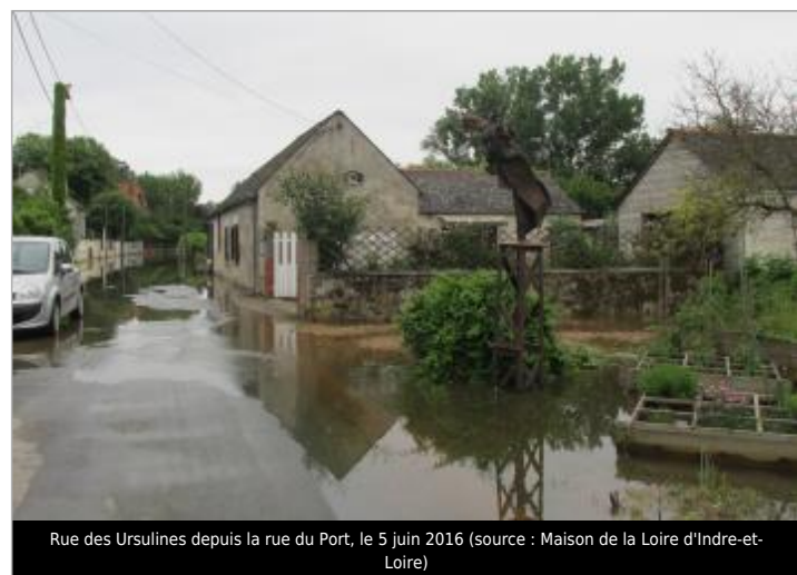
Rue des Ursulines depuis la rue du Port, le 5 juin 2016