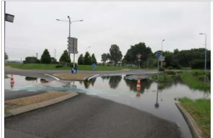
Site pendant la crue, le 2 juin 2016