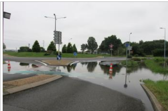
Site pendant la crue, le 2 juin 2016