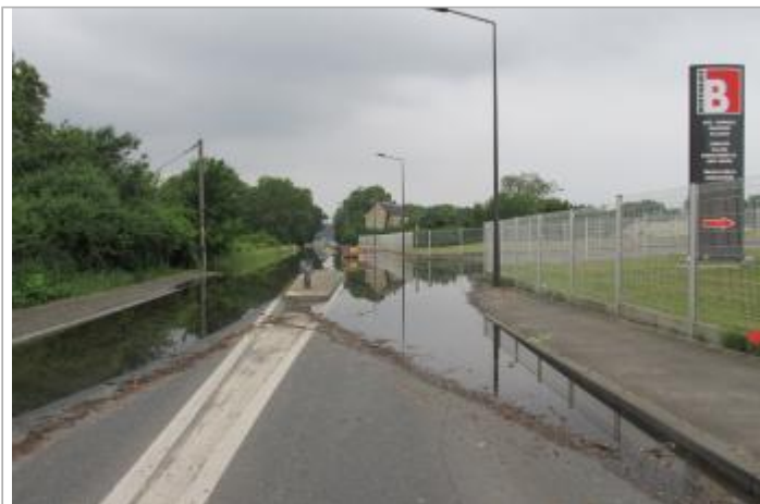
Route de Savonnière pendant la crue du Cher de juin 2016