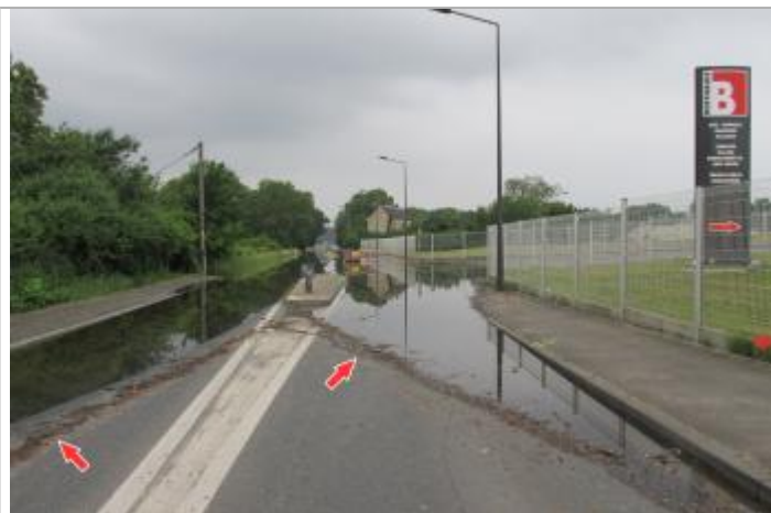
Laisse d'inondation sur la route de savonnières