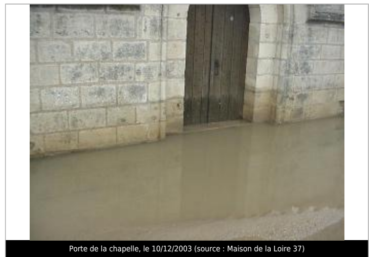
Porte de la chapelle, le 10/12/2003