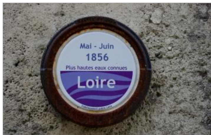
Marque de la crue de mai-juin 1856