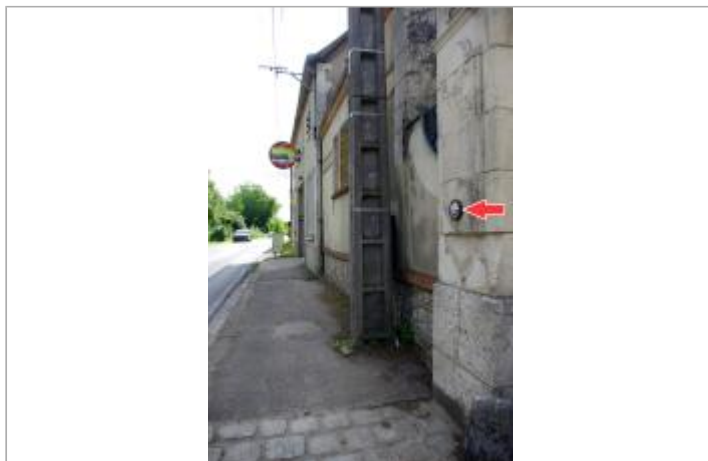
Site sur le quai Albert Baillet