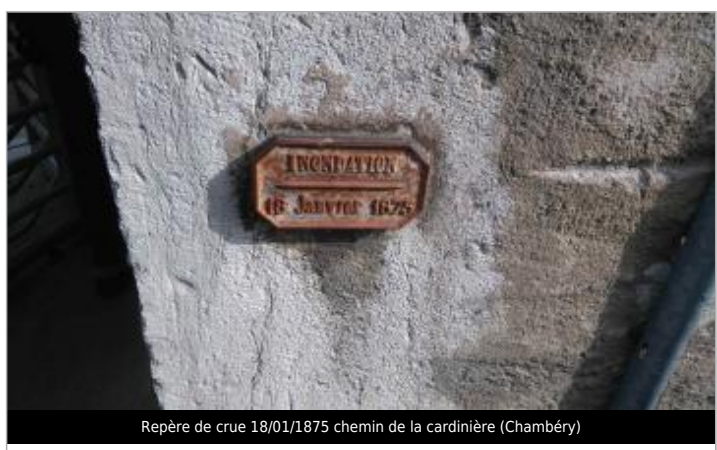
Repère de crue 18/01/1875 chemin de la cardinière (Chambéry)

MARQUE Texte : 18 janvier 1875 Visibilité : Oui État du repère : Bon Pérennité : Longue