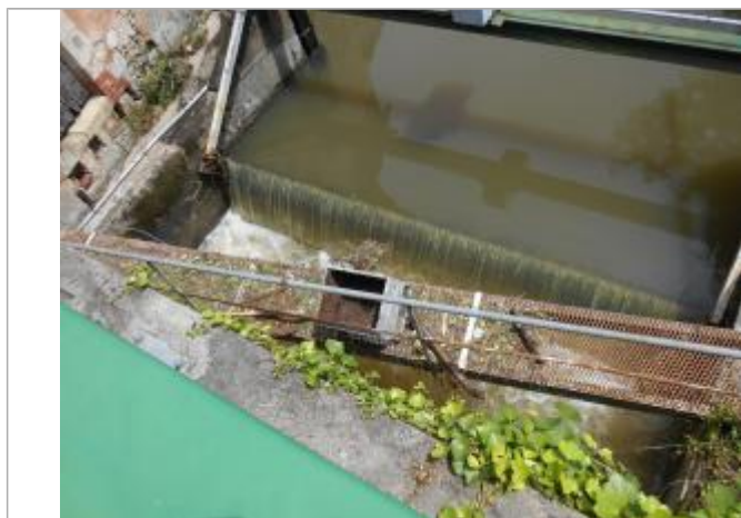
Repère de crue sur la passerelle de la pelle