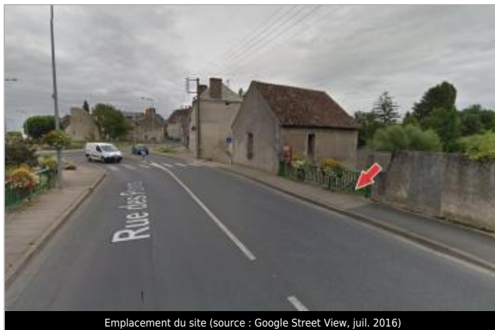
Emplacement du site